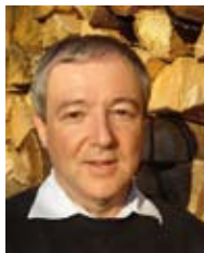
Andreas Götz, Vice-directeur Office fédéral de l'environnement OFEV

Les constructions durables dans le domaine des bâtiments pour l'artisanat et les services seront présentées à la Foire Maison et Energie de cette année. L'OFEV soutient expressément cette intention et vous invite à la manifestation «Bâtiments en bois pour l'artisanat et les services – durables – économiques – novateurs».